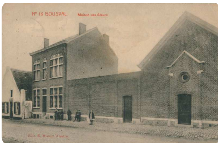
Carte postale de l'école S te - Marie en 1907

Les élèves de 6 è e de l'école S te - Marie