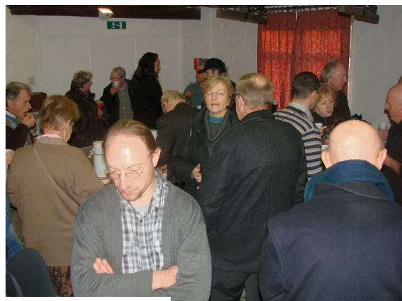
AG 2012 Pause café

Vous pouvez aussi participer aux activités de l'association :