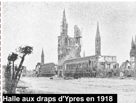
Halle aux draps d'Ypres en 1918