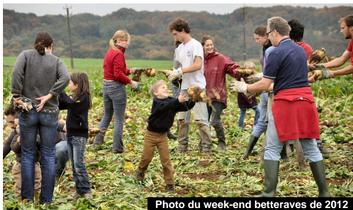
Photo du week-end betteraves de 2012

Nous sommes prêts, il ne manque plus que vous !