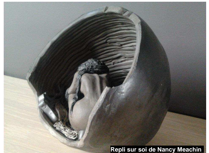
Repli sur soi de Nancy Meachin

Cette exposition a rencontré un franc succès tant par la qualité que par la variété des œuvres proposées.