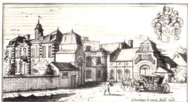
De Dominio La Motte - Castellum

Garde la mémoire du château aujourd'hui disparu par manque d'entretien.